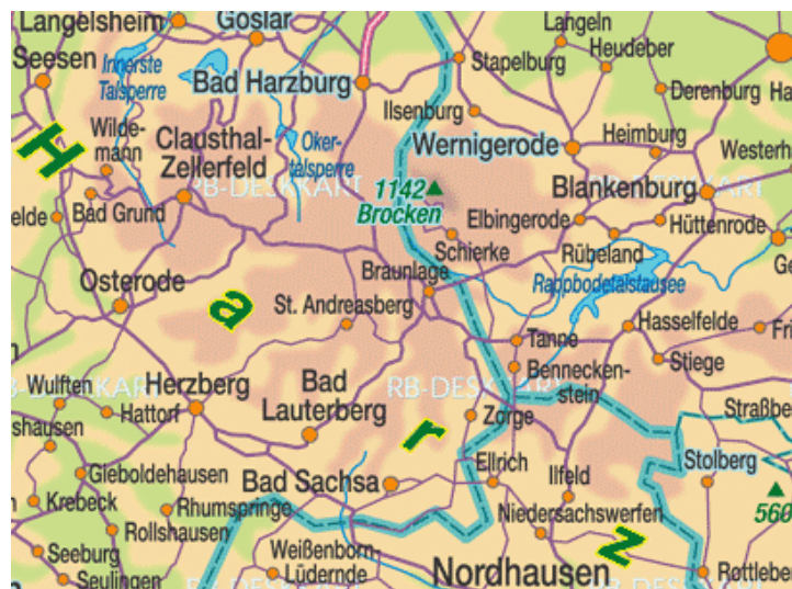
Mapa da região de Harz (Brocken)

Brocken é a mais alta das Montanhas de Harz norte central da Alemanha.